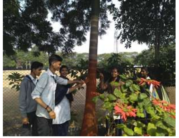
महाविद्यालयातील वृक्षांना रंगरंगोटी करतांना स्वयंसेवक