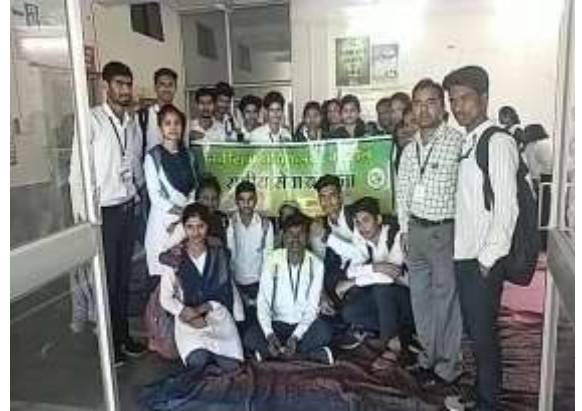
हत्तीरोग निर्मूलन अभियान प्रशिक्षणात सहभागी स्वयंसेवक