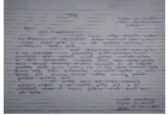
राष्ट्रीय सेवा योजनेच्या स्वयंसेवकांनी पूरग्रस्तांना पाठवलेली संवेदना पत्र