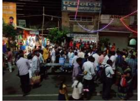
महाप्रसाद पाणी वितरण आणि सामाजिक संदेश प्रसारण कार्यक्रमात सहभागी स्वयंसेवक, कार्यक्रम अधिकारी व प्राध्यापक