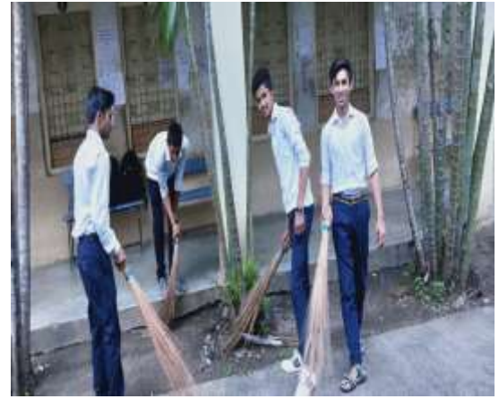
स्वच्छता अभियानात सहभागी प्राध्यापक आणि महाविद्यालय परिसरस्वच्छता करताना स्वयंसेवक