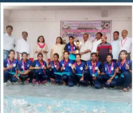
NAGPUR UNIVERSITY KHO-KHO(WOMEN) 9 TH TIME WINNER TEAM