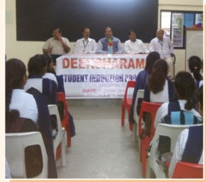
Student Induction Program organised by Equal Opportunity Centre