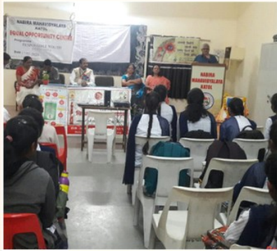
'Responsible Youth' Program organised by Equal Opportunity Centre