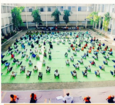
आंतरराष्ट्रीय योग दिवस क्षणचित्रे