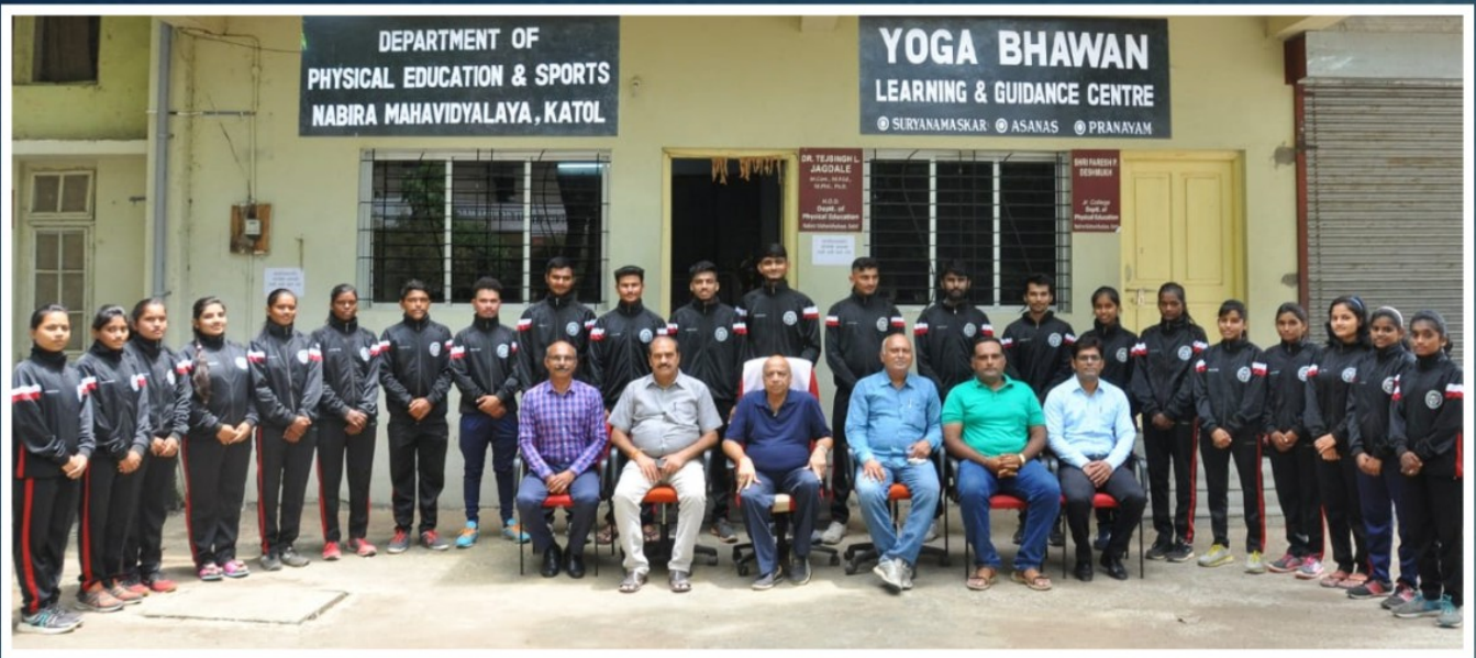
NAGPUR UNIVERSITY COLOUR HOLDER 2019-20