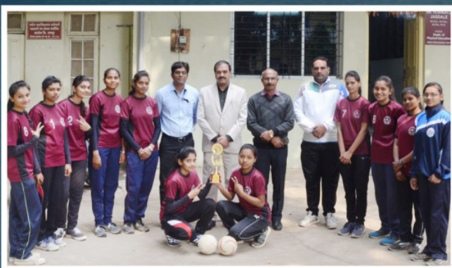
NAGPUR UNIVERSITY HANDBALL (WOMEN) FIRST TIME WINNER TEAM