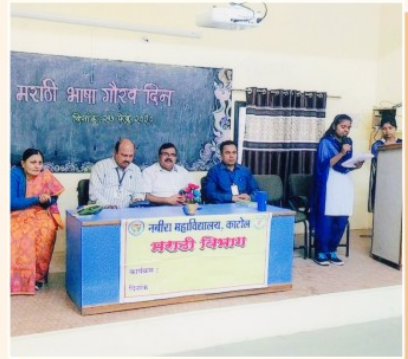
मराठी भाषा गौरव दिन