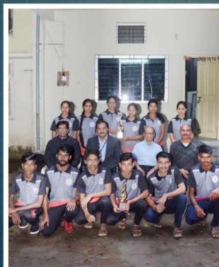
NAGPUR UNIVERSITY YOGASAN WINNER WOMEN 10 TH TIME & MEN 3 RD TIME