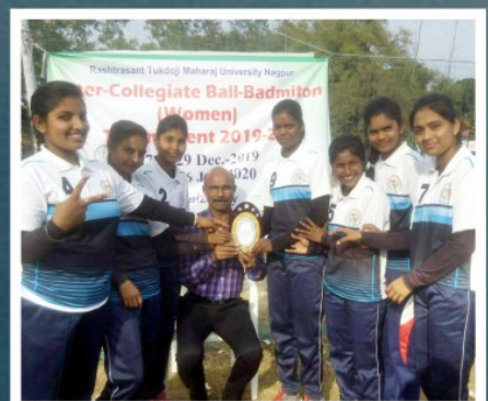
NAGPUR UNIVERSITY BALL-BADMINTON (WOMEN) 7 TH TIME WINNER TEAM