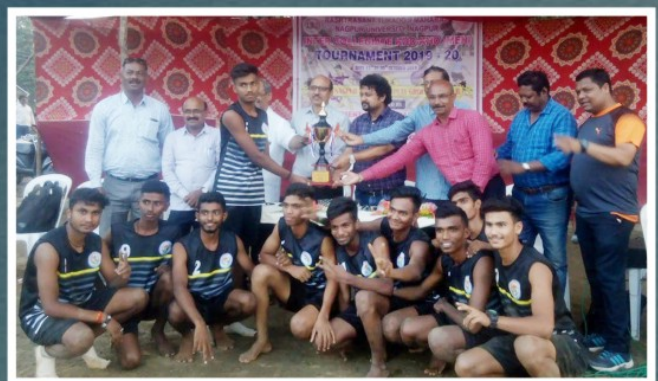
NAGPUR UNIVERSITY KHO-KHO (MEN) 13 TH TIME WINNER TEAM