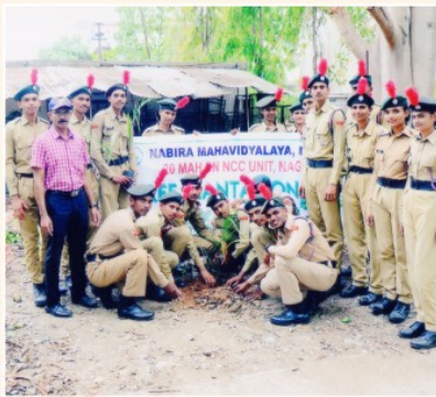
एन.सी.सी.विभागाद्वारे आयोजित 'वृक्षारोपण कार्यक्रम'