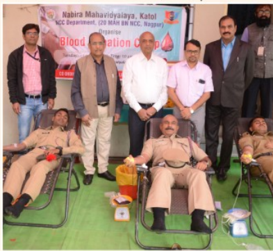
एन.सी.सी.विभागाद्वारे आयोजित रक्तदान शिविर