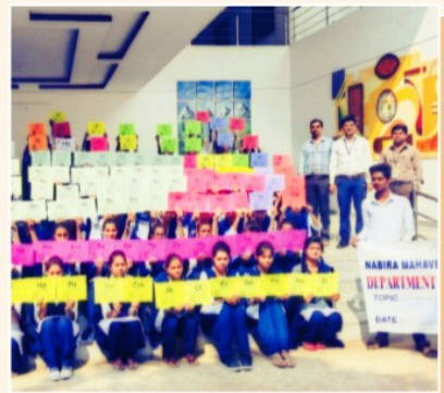
Department of Chemistry organized International Year of Periodic Table