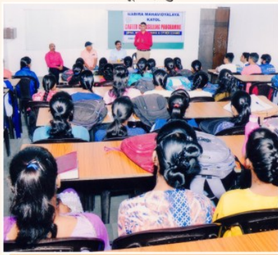
महाविद्यालयाद्वारे आयोजित करिअर कौन्सिलिंग प्रोग्राम