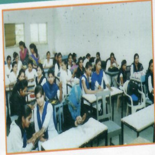
सांस्कृतिक मंडळाद्वारे आयोजित रांगोळी आणि मेहंदी स्पर्धेत सहभागी विद्यार्थीनी