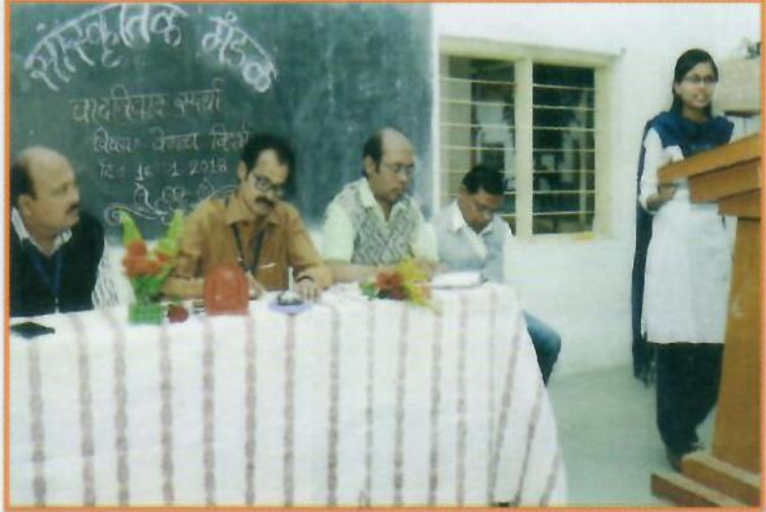
सांस्कृतिक मंडळाद्वारे आयोजित वादविवाद स्पर्धेत सहभागी विद्यार्थी