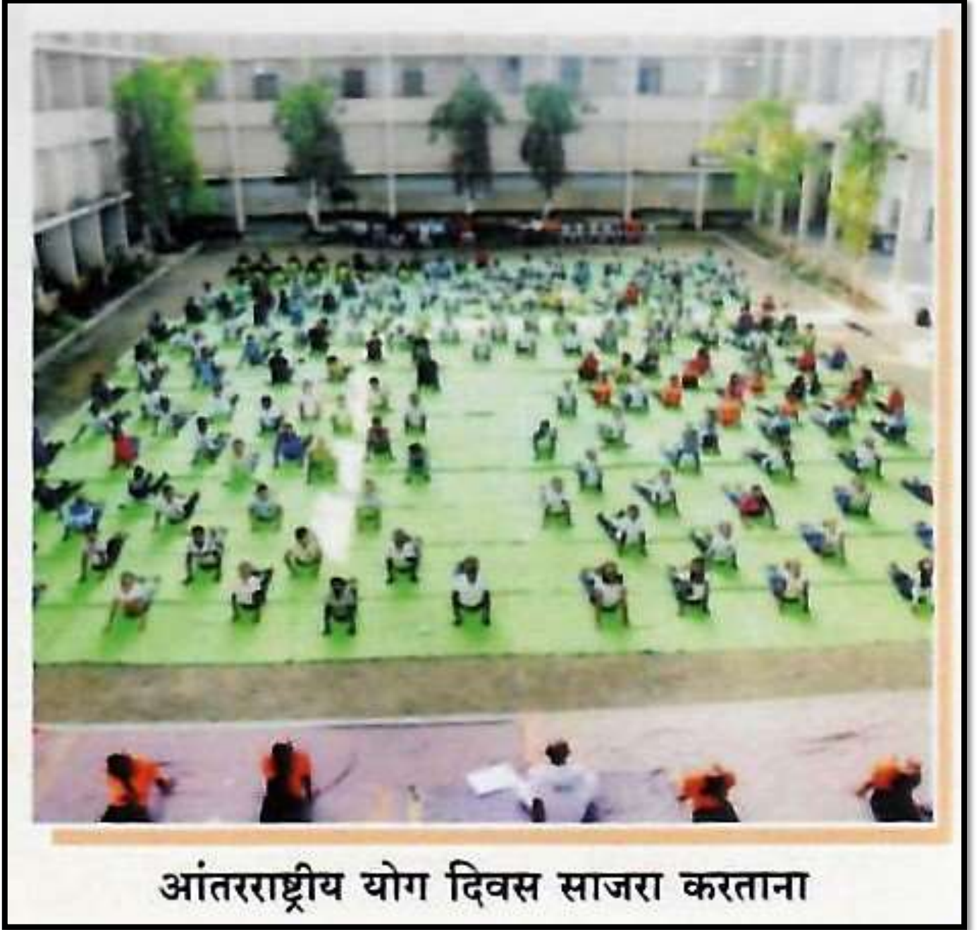
आंतरराष्ट्रीय योग दिवस साजरा करताना