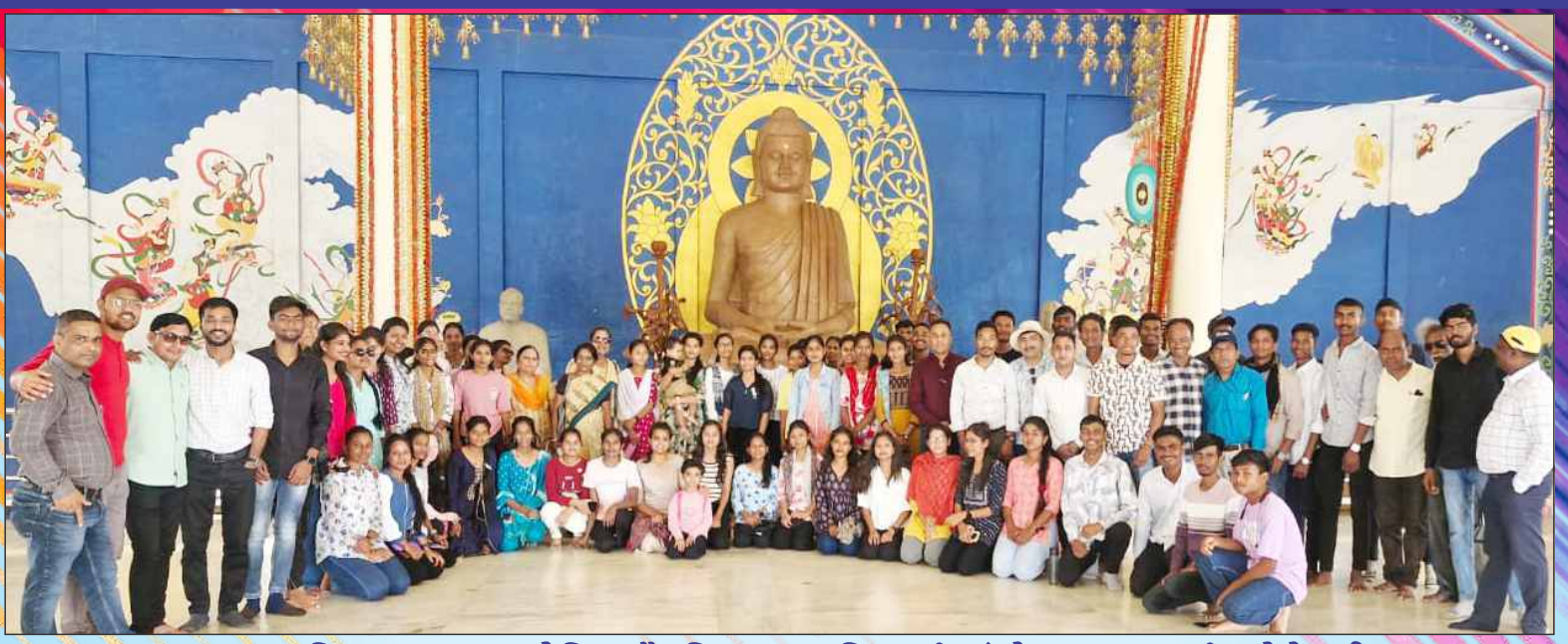
मानव्यशास्त्र विभागाद्वारा आयोजित शैक्षणिक सहल सिद्धपुरी, अंभोरा, रावणवाडी, गोसेखुर्द धरण