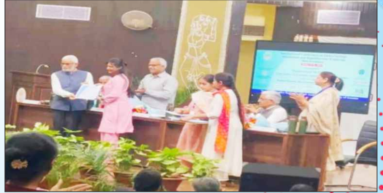
Student of the Zoology Dept. Receiving Award in J & K