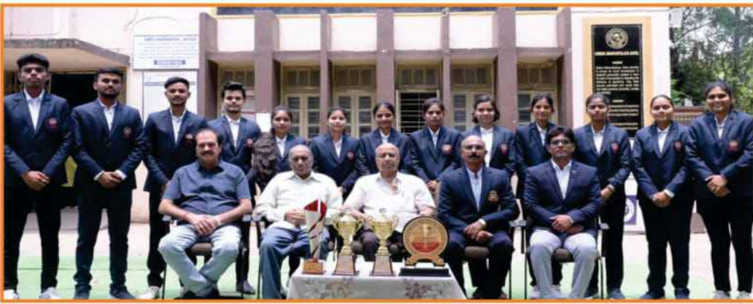
RTM Nagpur University Colour Holders (2024 - 25)