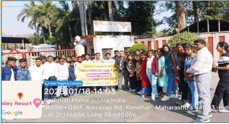
अर्थशास्त्र विभागाद्वारा आयोजित औद्योगिक क्षेत्र भेट