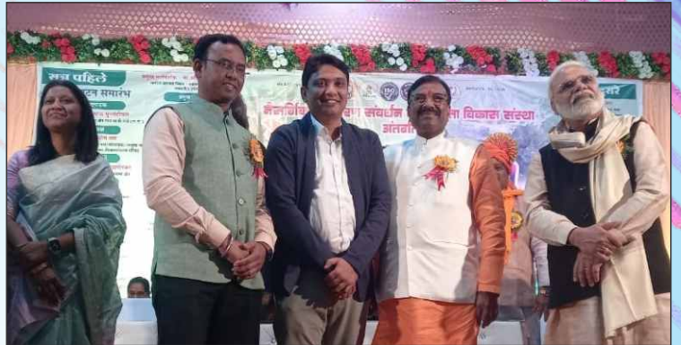
Dr. B. B. Kalbande Was Honored With the Prestigious 'Paryavaran Mitra Puraskar' by Hon'ble cabinet Minister Shri Sudhir Mungantiwar