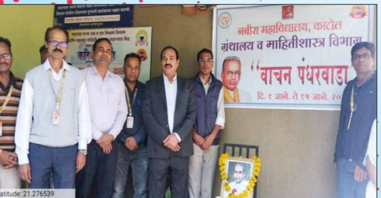
ग्रंथालय विभागाद्वारा आयोजित वाचन पंथरवाडा