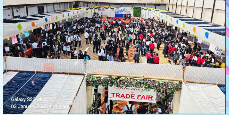
वाणिज्य विभागाद्वारा आयोजित व्यापार मेळावा