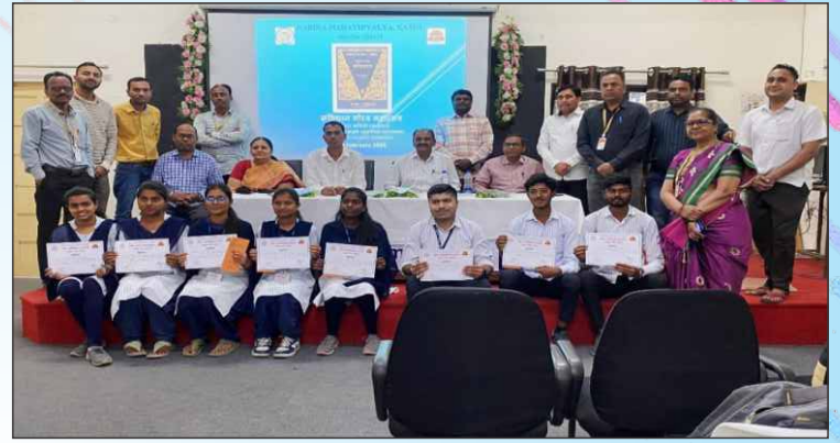
संविधान गौरवदिन - २०२४