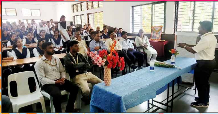
Workshop Simulation Software Bootcamp by Dept. of Electronics