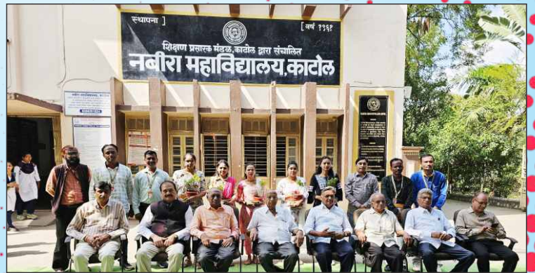
इतिहास विभागातील गुणवंत विद्यार्थ्यांचा सत्कार करताना संस्थेचे सन्माननीय संचालक मंडळ