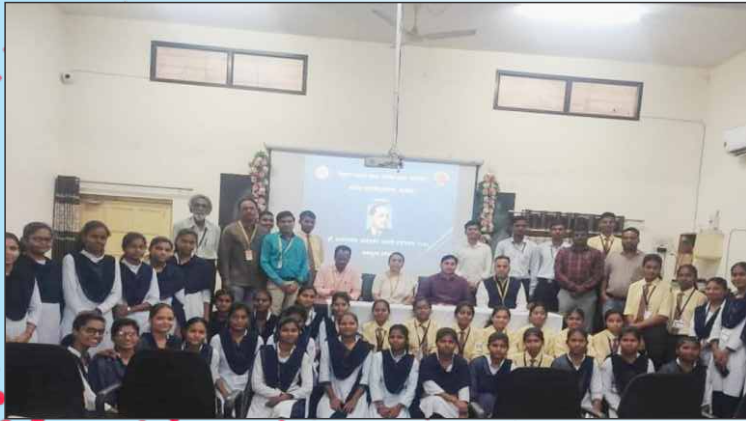
डॉ. बाबासाहेब आंबेडकर जयंती महोत्सव - २०२४