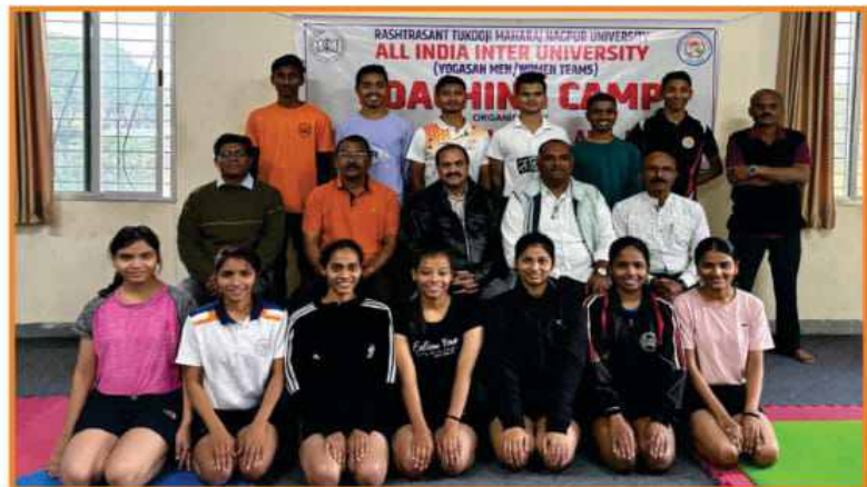
RTM Nagpur University Selected Yogasan (M/W) Teams for All India Inter-University Coaching Camp