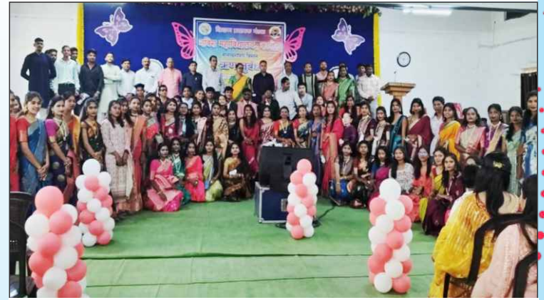
मानव्यशास्त्र विभागातील विद्यार्थ्यांचा स्वागत समारंभ