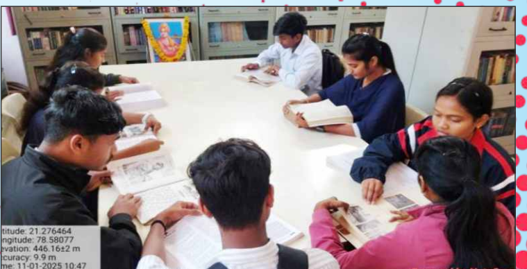
स्वामी विवेकानंद जयंतीनिमित्त अध्ययन करताना विद्यार्थी