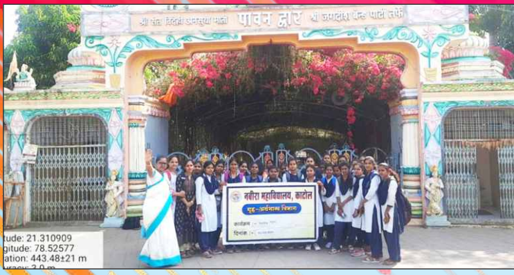
गृहअर्थशास्त्र विभागाची एकदिवसीय शैक्षणिक सहल पारडसिंगा