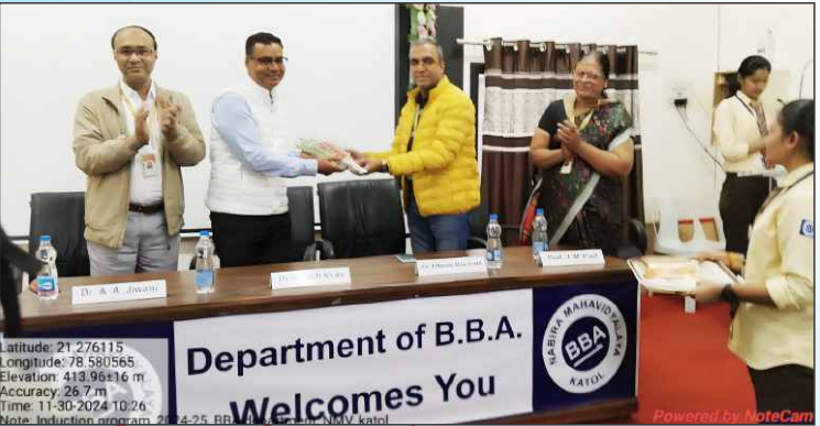
Induction Program BBA Department