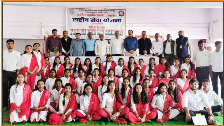
NSS Camp at Digras