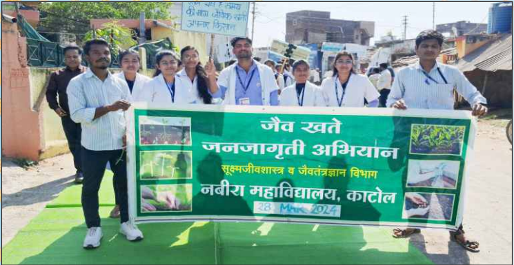
Bio Fertilizer Awareness Rally Organized By Dept. of Microbiology & Biotechnology