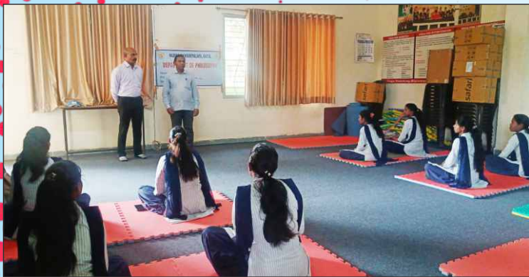
तत्त्वज्ञान विभागाद्वारा आयोजित ध्यान आणि योग कार्यशाळा