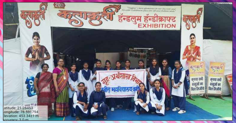
गृहअर्थशास्त्र विभागाची कलाकृती प्रदर्शनीला भेट