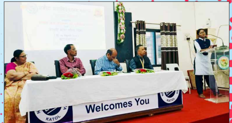
मराठी भाषा गौरव दिनानिमित्त काव्यवाचन करताना विद्यार्थीनी