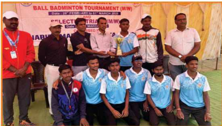
RTM Nagpur University Ball Badminton Runner Team