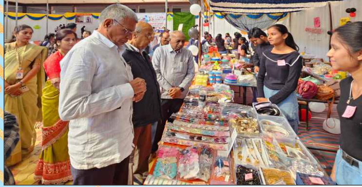
वाणिज्य विभागाद्वारा आयोजित विद्यार्थ्यांच्या व्यापार मेळावा प्रसंगी निरीक्षण करताना संस्थेचे संचालक मंडळ पदाधिकारी