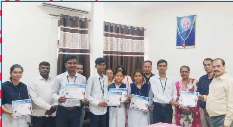
'सानेगुरुजी' या लघुपटाला जळगाव विद्यापीठाचा तृतीय पुरस्कार प्राप्त झाल्याने मानव्यशास्त्रे विभागातील विद्यार्थ्यांचा सत्कार करताना मा. प्राचार्य