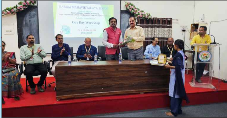
One Day WorkShop on IPR & Plagiarism Organized by Dept. of Commerce, Chemistry, English & IPR Cell