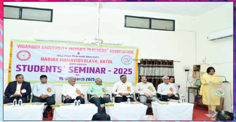
Student's Seminar - 2025 Organized by Dept. of Physics