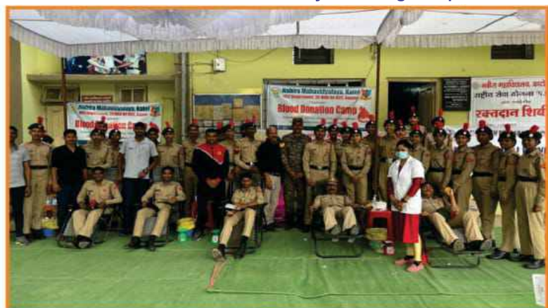
Blood Donation Camp Organized by N.C.C. Department